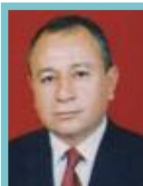
Yakup YILMAZER Meclis Üyesi