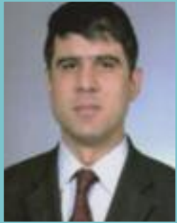
Ömer AKÇELİK Meclis Başkanı